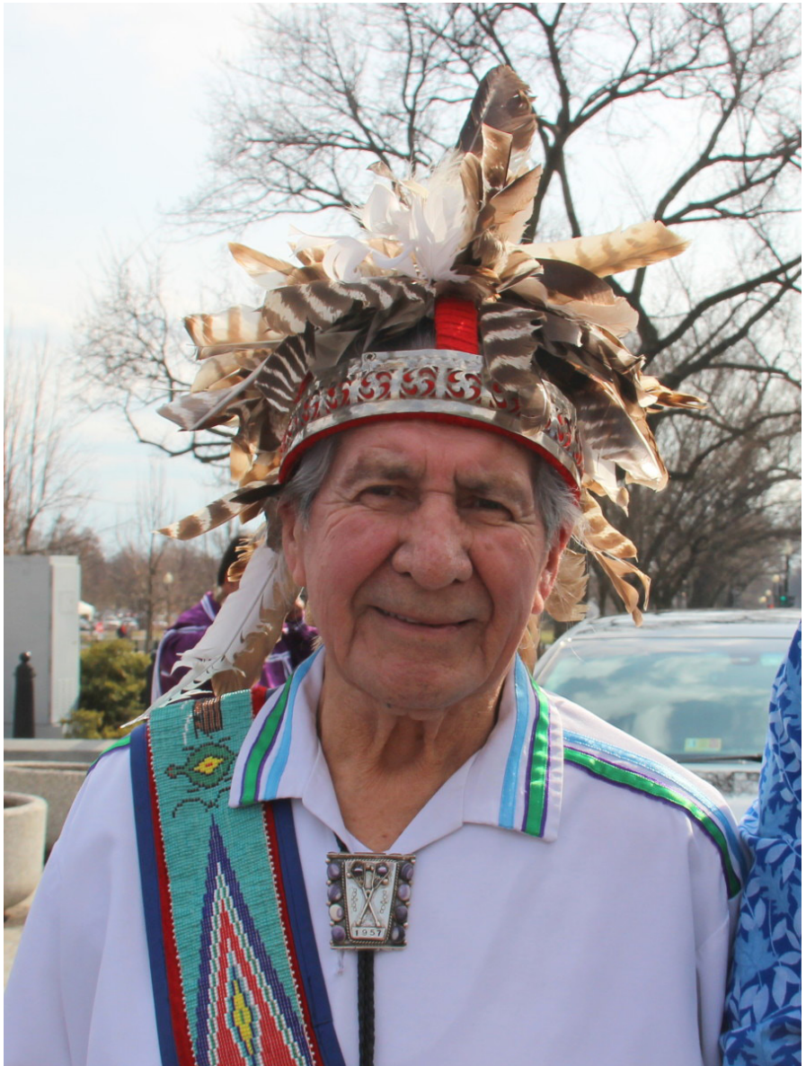
Jefe Oren Lyons, Guardián de la Fe del Clan Tortuga