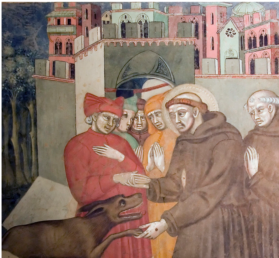
"San Francisco y el Lobo de Gubbio", Cristoforo di Bindoccio y Meo di Pero , C. 1363 Fresco, Capilla de San Francesco, Pienza, Italia