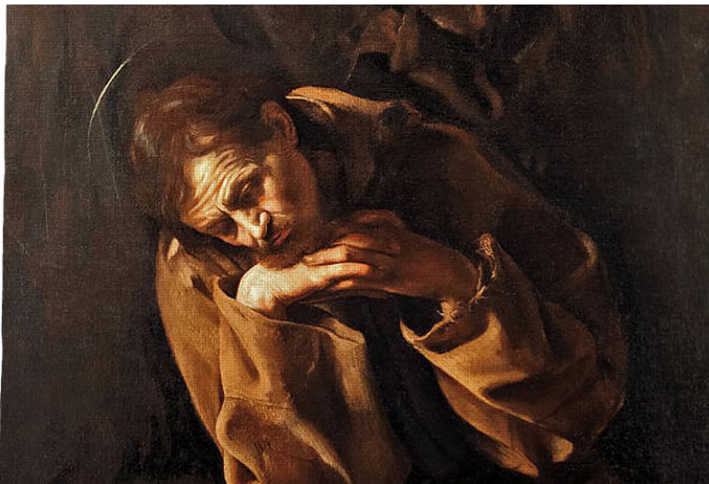
San Francisco en Meditación

Señor Jesucristo, Hijo de Dios, ten piedad de mí, pecador.